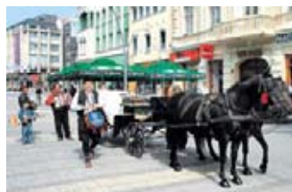
18 - 19. septembar ŠABAC "ŠABAČKA ČIVIJADA"

Vukov sabor je najstarija i najmasovnija kulturna manifestacija u Srbiji, koja se održava od 1933. godine. U čudesnom ambijentu sela Tršića, u kome se nalaze objekti stare srpske arhitekture, prikazuje se umetnička ostvarenja u čast Vuka Karadžića.