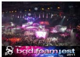
3. septembar BEOGRAD "BELGRADE FOAM FEST 2011"

"Belgrade Foam Fest" je najspektakularniji muzičko-scenski događaj kod nas i najveća pena žurka na svetu. Nastao je 2009. godine i od tada ga je posetilo više od 40000 ljudi. Ove godine očekuje vas 16000 ljudi koji zajedno igraju u 200000 hektolitara pene i 52 DJ-a na 3 stage-a.