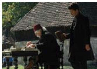
12 - 18. septembar TRŠIĆ "VUKOV SABOR"

Manifestacija obuhvata takmičenje u pripremanju svadbarskog kupusa u zemljanom loncu, brojna takmičenja poljoprivrednog karaktera, pesničke večeri i nastupe poznatih estradnih umetnika.