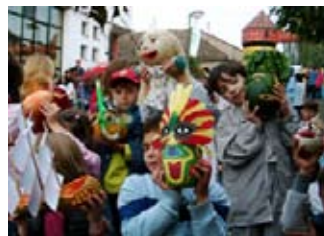
23 - 25. septembar SREMSKI KARLOVCI „KARLOVAČKA BERBA GROŽĐA"

U Irigu se od 1993. godine, svake godine organizuju „Pudarški dani“. Ova manifestacija je posvećena pudaru – čuvaru vinograda, vinu i grožđu, razvoju vinogradarstva. Manifestacije traje tri dana, praćena raznovrsnim zanimljivim dešavanjima.