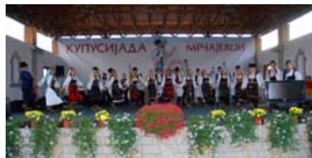
16 - 18. septembar MRČAJEVCI "KUPUSIJADA"

"Belgrade Foam Fest" je najspektakularniji muzičko-scenski događaj kod nas i najveća pena žurka na svetu. Nastao je 2009. godine i od tada ga je posetilo više od 40000 ljudi. Ove godine očekuje vas 16000 ljudi koji zajedno igraju u 200000 hektolitara pene i 52 DJ-a na 3 stage-a.