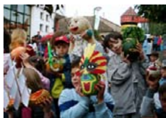
15 - 17. septembar IRIG "PUDARSKI DANI"

Na "Belosvetskom festivalu humora i satire" održavaju se pozorišne predstave, takmičenja u duhovitosti, proglašenje pobednika nagradnog konkursa za najbolju priču, aforizam i karikaturu.